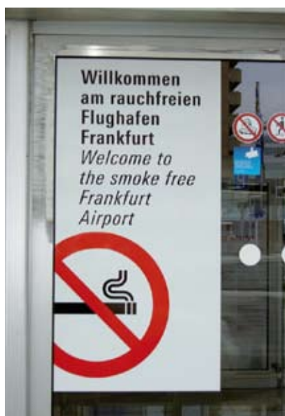
Рисунок 2. Табличка на входе в аэропорт Франкфурта вводит в заблуждение, о чем свидетельствует место для курения, спонсором которого являются сигареты Camel 10

Такой подход обеспечивает достаточную гибкость в сочетании с конкретикой, что позволяет наиболее широко защитить население и внести в список мест, свободных от табачного дыма, дополнительные уточнения, если таковые понадобятся после вступления закона в силу.