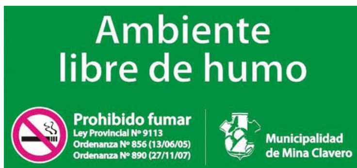
Источник: Муниципалитет г. Мина Клаверо, Аргентина