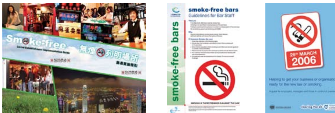
Рисунок 7. Брошюры и листовки для бизнесменов и персонала (слева направо) из Гонконга, Ирландии и Шотландии. Шотландская брошюра доступна на девяти языках 36,37,38

Источники: Китай, Гонконг. Department of Health. Tobacco Control Office (слева), Office of Tobacco Control, Ирландия (в центре), Healthier Scotland (справа)