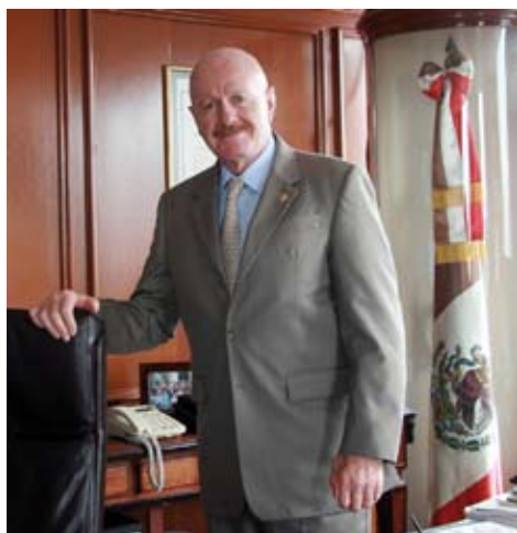
Рисунок 8: Известные политики из разных стран (слева направо): Мануэль Мондрагон, бывший министр здравоохранения Мехико; Табаре Васкес, бывший президент Уругвая 48

В большинстве стран, успешно принявших эффективное законодательство по созданию среды, свободной от табачного дыма, в процессе участвовал хотя бы один известный политик, который оказывал поддержку законодательной инициативе и продвигал идею в СМИ (рисунок 8).