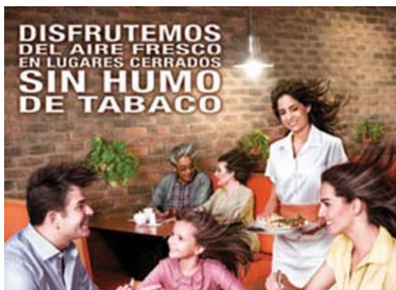
Рисунок 6. Плакаты, посвященные исполнению законов о создании среды, свободной от табачного дыма, в барах и ресторанах Мехико (слева) и Уругвая (справа) 49

Многие из характерных примеров, приведенных в разделе ссылок, также рассказывают о возможности привлечения неоплачиваемого внимания СМИ к проблеме законодательства по созданию среды, свободной от табачного дыма.