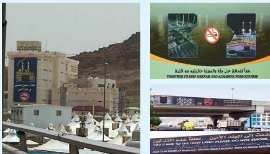
Рисунок 3. Рекламные щиты и другие наглядные материалы в Мекке и Медине 46

31 мая 2001 года ныне покойный король Саудовской Аравии Фахд объявил, опубликовав соответствующий королевский указ, что священные города Мекка и Медина должны стать свободными от табачного дыма. Обоснование данного решения и кампания в его поддержку основывались на религиозных догматах ислама, в частности на изложенной в Коране и учении Пророка Мухаммеда заповеди беречь свое здоровье и имущество.