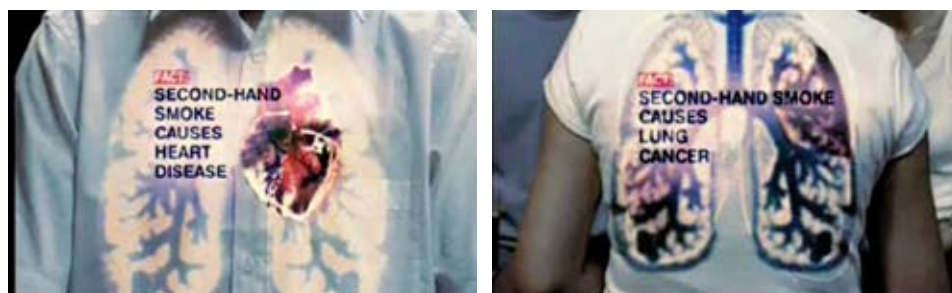
Рисунок 5. Ирландская кампания «Работа, свободная от табачного дыма», привлекающая внимание к проблеме защиты здоровья работников. 31 «По закону бары, рестораны и другие рабочие места должны быть свободными от табачного дыма. Почему? Потому что вредное воздействие вторичного табачного дыма приводит к серьезным и часто смертельным болезням. Так что помни, если ты отдыхаешь, то я работаю. Как и ты, конечно же. Работа должна быть свободной от табачного дыма. По закону». 47